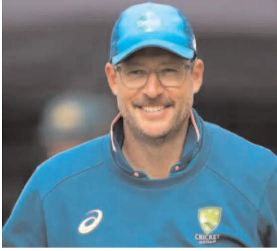
ఆస్ట్రేలియా నుండి ప్రకటన పెర్ట్ టెస్టుకు డేనియల్ వెట్టోరి తప్పుకోవడం గురించి క్రికెట్ ఆస్ట్రేలియా ప్రతినిధి

ప్రస్తుతం భారత జట్టు ఆస్ట్రేలియా పర్యటనలో ఉంది. నవంబర్ 22 నుంచి ఇరు జట్ల మధ్య టెస్టు సిరీస్ ప్రారంభం కానుంది. ఈ సిరీస్ కు ముందు ఆస్ట్రేలియాకు గట్టి ఎదురుదెబ్బ తగిలింది. ఆస్ట్రేలియా అసిస్టెంట్ కోచ్ డేనియల్ వెట్టోరి పెర్ట్లో జరిగే మొదటి బోర్డర్-గవాస్కర్ ట్రోఫీ టెస్టు కు దూరం కానున్నాడు. బదులుగా ఐపీఎల్ 2025 మేగా వేలంలో పాల్గొనాలని నిర్ణయించుకున్నాడు. ఐపీఎల్లో సన్రైజర్స్ హైదరాబాద్ ప్రధాన కోచ్ గా కూడా డేనియల్ వెట్టోరి వ్యవహరిస్తున్నాడు. అయితే ఈ విషయాన్ని వెట్టోరి క్రికెట్ ఆస్ట్రేలియాకు తెలియజేశాడు. దీని తర్వాత వెట్టోరి ఇప్పుడు భారతదేశం - ఆస్ట్రేలియా మధ్య జరిగే మొదటి టెస్టు కోసం ఆస్ట్రేలియా జట్టు బాధ్యతను వదిలివేయనున్నాడు. జెడ్యూల్లో జరగనున్న ఐపీఎల్ 2025 మేగా వేలంలో పాల్గొంటాడు. క్రికెట్