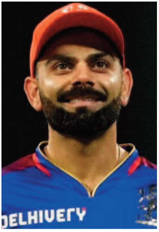
స్పిన్నర్ ఆరీసీబీ తరపున ఇప్పటికే అత్యధిక వికెట్లు తీసిన బౌలర్ గా ఉన్నాడు. గతంలో ఎన్నో మ్యాచ్ లలో ఆరీసీబీ అద్భుత విజయాలను చహల్ అందించాడు. ఐపీఎల్ 2025 వేలంలో చహల్ కు భారీ ధర పలికే అవకాశం ఉంది. మరి ఏ జట్టు అతడిని సొంతం చేసుకుంటుందో చూడాలి.

నవంబర్ 24, 25 తేదీల్లో ఐపీఎల్ 2025 మేగా వేలం సౌదీ అరేబియాలోని జెడ్డాలో జరగనుంది. వేలానికి ముందు రాయల్ ఛాలెంజర్స్ బెంగళూరు (ఆరీసీబీ) ముగ్గురు ఆటగాళ్లను మాత్రమే రిటైన్ చేసుకుంది. స్టార్ బ్యాటర్ విరాట్ కోహ్లా (రూ. 21కోట్లు)ని టాప్ రిటెన్షన్ గా తీసుకోగా.. బ్యాటర్ రజత్ పాటిదార్ (రూ. 11కోట్లు), పేసర్ యుజ్ దయాల్ (రూ. 5కోట్లు)ను అడ్డిపెట్టుకుంది. ఫాఫ్ దుషేసిన్, గ్లెన్ మ్యాక్స్ వెల్, మహమ్మద్ సిరాజ్ లాంటి స్టార్ ఆటగాళ్లను వేలంలోకి వదిలేసింది. రూ. 83 కోట్ల వర్న్ మనీతో మంచి ఆటగాళ్లను కొనేందుకు ఆరీసీబీ సిద్ధమైంది. ఆరీసీబీ కెప్టెన్ గా విరాట్ కోహ్లా మరలా బాధ్యతలు చేపట్టే అవకాశం ఉన్నట్లు సోషల్ మీడియాలో ప్రచారం జరుగుతోంది. ఈ క్రమంలోనే బెంగళూరు వేలంపై స్టార్ స్పోర్ట్స్ షో గేమ్ ప్లాన్ లో టీమిండియా మాజీ క్రికెటర్, వ్యాఖ్యాత సంజయ్ మంజ్రేకర్ స్పందించాడు. ఆరీసీబీ కెప్టెన్ గా కోహ్లా బాధ్యతలు స్వీకరిస్తే.. స్టార్ స్పిన్నర్ యుజ్వేంద్ర్ చహల్ ను తీసుకునేందుకు ప్రయత్నిస్తాడని తెలిపాడు. 'చహల్ ను దక్కించుకోవడం ఆరీసీబీకి చాలా కష్టమని నేను అనుకుంటున్నా. ఎందుకంటే ఆర్ అశ్విన్, చహల్ భాగస్వామ్యాన్ని కొనసాగించడానికి రాజస్థాన్ రాయల్స్ ప్రయత్నం చేస్తుంది. విరాట్ కెప్టెన్ అయితే పాత బ్రండ్ కార్డు చహల్ ను తిరిగి జట్టులో చేర్చుకోవడానికి ప్రయత్నిస్తాడు. ఆరీసీబీ కెప్టెన్ గా కోహ్లా వస్తే జట్టులో చాలా మార్పులు జరుగుతాయి' అని సంజయ్ అన్నాడు. ఐపీఎల్ 2024లో రాజస్థాన్ రాయల్స్ తరపున చహల్ 15 ఇన్నింగ్స్ లో 9.41 ఎకానమీ రేటుతో 18 వికెట్లు తీశాడు. 160 ఐపీఎల్ మ్యాచ్ లలో యూజీ 205 వికెట్స్ పడగొట్టాడు. ఆరీసీబీ తరపున 112 ఇన్నింగ్స్ లో 7.58 ఎకానమీ రేటుతో 139 వికెట్స్ తీశాడు. ఈ లెగ్