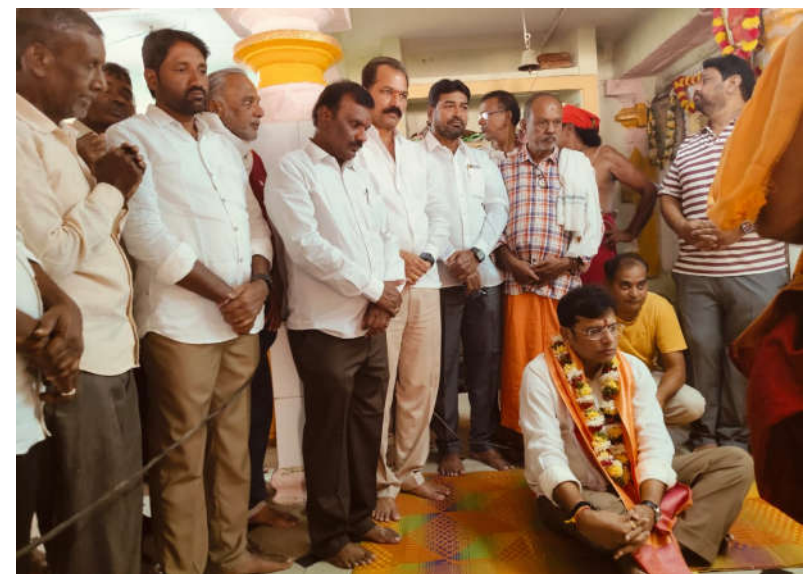
మంధని, డిసెంబర్ 12

మంధని పట్టణంలోని దత్తాత్రేయ స్వామి ఆలయంలో రాష్ట్ర బడి పరిశ్రమల శాసనసభ వ్యవహారాల శాఖ మంత్రి దుద్దిళ్ళ శ్రీధర్ బాబు గురువారం స్వామివారిని దర్శించుకున్నారు. ఈ సందర్భంగా ఆలయ పూజారి మంత్రిని శాలువాతో సన్మానించారు. శ్రీ దత్త ఉపాసకులైన దివంగత ఉమ్మడి రాష్ట్ర మాజీ స్పీకర్ దుద్దిళ్ళ శ్రీపాదరావు దత్త భక్తుడు. ఆయన ఎప్పుడూ స్వామివారిని దర్శించుకునేవారు. అదే వరంవరలో మంత్రి శ్రీధర్ బాబు సైతం మంధనిలో ఉన్నారు అంటే చాలు శ్రీ దత్తాత్రేయ స్వామి ని తప్పనిసరిగా దర్శించుకుంటారు. రాష్ట్ర మంత్రిగా ఎంతో బిజీగా ఉన్న