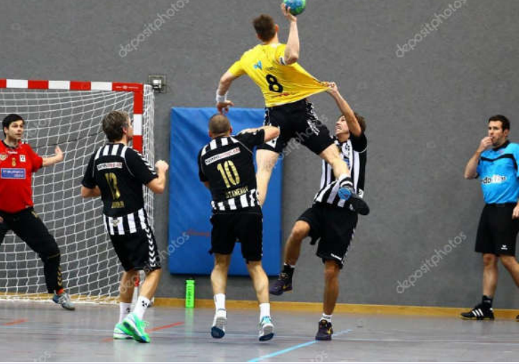
ఆర్కూర్, డిసెంబర్ 12 (ప్రజా శంఖారావం):