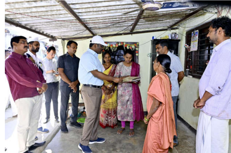
ఆర్కూర్, డిసెంబర్ 12 (ప్రజా శంఖారావం):