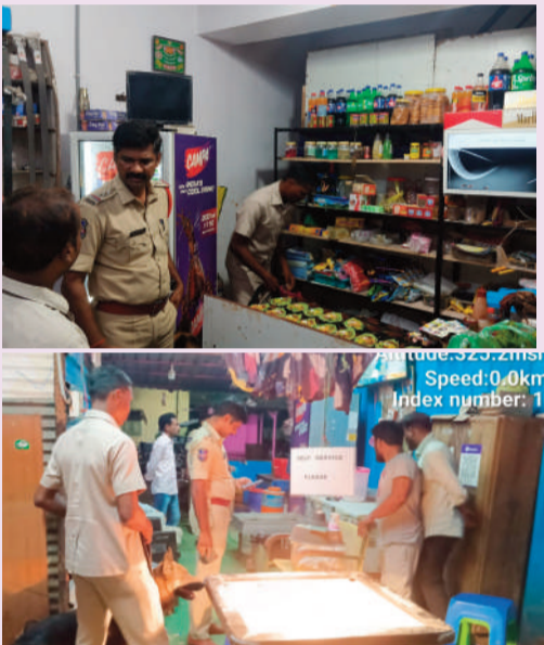
ఆర్టీసీ బస్టాండ్ లో (ప్రజా శంఖారావం):