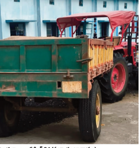
ఇందల్యాం, ఏప్రిల్ 24 (ప్రజా శంఖారావం):