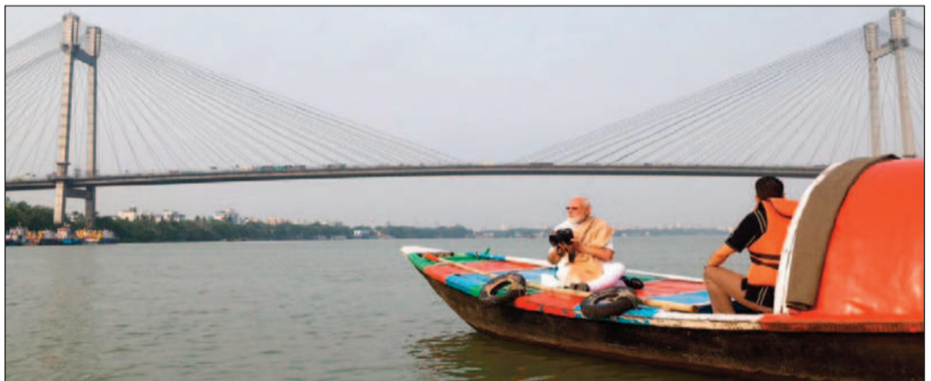
ఎన్నికల్లో గెలిపిస్తే.. పశ్చిమ బెంగాల్ అభివృద్ధికి, ప్రజల శ్రేయస్సు కోసం తమ ప్రభుత్వం కృషి చేస్తుందన్నారు. హుగ్లీ నది ఒడ్డున తాను వెచ్చించిన సమయం చాలా

కోల్కతా, ఏప్రిల్ 24: గడ్వాలీ నదిలో ప్రధాని సరేంద్ర మోడి పశ్చిమ బెంగాల్లో పర్యటిస్తున్నారు. శుక్రవారం కోల్కతాలోని హుగ్లీ నదిలో బోట్ రైడ్ కు వెళ్లారు. ఈ సందర్భంగా కెమెరాను చేతపట్టి నది అందాలను క్షీమనిపించారు. దీనికి సంబంధించిన ఫోటోలను ఆయన ఎక్స్ లో పంచుకున్నారు. హుగ్లీ నది బెంగాల్ సంస్కృతిలో ముడిపడి ఉందని మోడి పేర్కొన్నారు. బెంగాల్ జీవితాల్లో గంగానదికి ఒక ప్రత్యేక స్థానం ఉందని, దాని జలాలు ఒక ప్రాచీన నాగరికత స్ఫూర్తిని మోస్తూనే ఉన్నాయి. ఈ రోజు ఉదయం హుగ్లీ నది తీరంలో కొంత సమయం గడిపినట్లు వెల్లడించారు. ఈ క్రమంలో నదిలో పడవ నడిపేవారితో పాటు, ఉదయపు నడకకు వచ్చిన వారితో కాసేపు ముచ్చటించినట్లు తెలిపారు. పడవ నడిపేవారి క్రామిక శక్తిని ఈ సందర్భంగా మోడి కొనియాడారు.