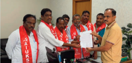
నిజామాబాద్ రూరల్ సిలకొండ, ఏప్రిల్ 24 (ప్రజా శంఖారావం):

జిల్లాలో ఇటీవల కురిసిన వడగండ్ల వానతో పంటలు తీవ్రంగా దెబ్బతిన్నాయని, రైతులు వెంటనే ఆదుకోవాలని సీపీఐ(ఎంఎల్) మాన్ లైన్, ఏఐయూకెస్ నేతలు ప్రభుత్వాన్ని డిమాండ్ చేశారు. సిరికొండ, ధర్మలి, ఇందల్యాది, డిపేపల్లి, ఆర్మూర్ తదితర మండలాల్లో వరి, మొక్కజొన్నతో పాటు టమాటా, మిర్చి, సుప్యలు, మామిడి పంటలు భారీగా నష్టపోయినట్లు తెలిపారు. చేతికొచ్చిన పంట నష్టపోవడంతో రైతులు తీవ్ర ఆర్థిక ఇబ్బందులు ఎదుర్కొంటున్నారని పేర్కొన్నారు. వరి ధాన్యం కొనుగోలు మందగించడం రైతులను మరింత ఇబ్బందులకు గురిచేసిందని తెలిపారు. దొడ్డు రకం ధాన్యాన్ని కూడా ఆలస్యం లేకుండా కొనుగోలు చేయాలని కోరారు. కొనుగోలు కేంద్రాల సంఖ్య పెంచి, సప్లయ్ హోరం వెంటనే అందించాలని ప్రభుత్వాన్ని విజ్ఞప్తి చేశారు.