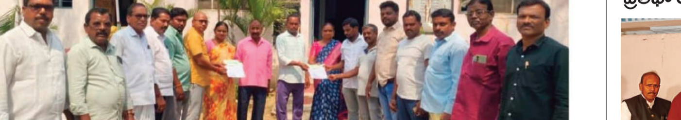
భీమగల్, ఏప్రిల్ 24 (ప్రజా శంఖారావం):