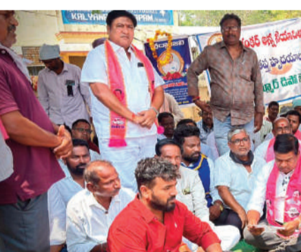
ఆర్కార్, ఏప్రిల్ 24 (ప్రజా శంఖారావం):