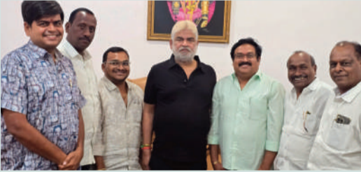
చేగుంట ఏప్రిల్ 24 (ప్రజా శంఖారావం):