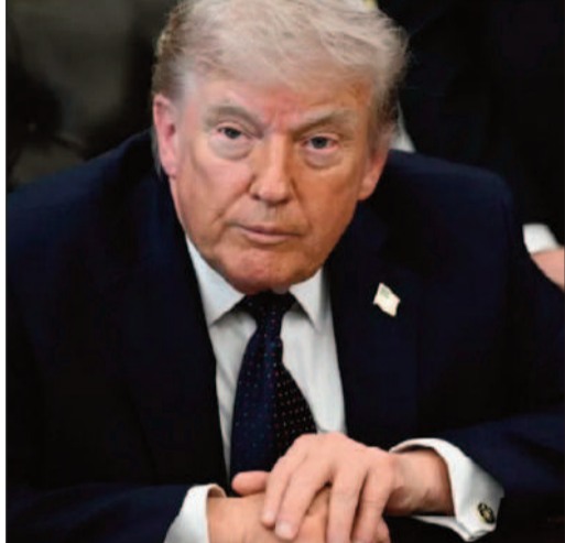
అభ్యాయుధాలను వాడటానికి అనుమతించకూడదు" అని ఆయన కీలక వ్యాఖ్యలు చేశారు. ఇరాన్ తో తూతూమంత్రంగా కాకుండా, దీర్ఘకాలికంగా ఉండే బలమైన ఒప్పందంపైనే తన దృష్టి ఉందని ఆయన పేర్కొన్నారు. ఇరాన్ పాలకులకు

తక్కువ సమయం ఉందని హెచ్చరిస్తూ ట్రంప్ ఒక పోస్ట్ పెట్టారు. "నాకు చాలా సమయం ఉంది, కానీ ఇరాన్ కు లేదు. వారి నాయకత్వం బలహీనపడింది, సైన్యం చిన్నాభిన్నమైంది. మేము విధించిన ఆర్థిక, సైనిక దిగ్బంధనం అద్భుతంగా పనిచేస్తోంది. ఇకపై పరిస్థితి మరింత దారుణంగా ఉంటుంది" అని అందులో రాసుకొచ్చారు. హర్రూజ్ జలసంధిలో మైస్సె పెట్టి ఇరాన్ పెద్ద తప్పు చేసిందని ఆయన మండిపడ్డారు. ఇటీవల ఇరాన్ పతాకంతో ఉన్న ఒక వాణిజ్య నౌకను అమెరికా సీజ్ చేసిన ఉదంతంపై ట్రంప్ స్పందించారు. ఆ నౌకలో వైనా నుంచి ఇరాన్ కు వెళ్తున్న ఒక 'బహామతి' ఉందని, అయితే అది అత్యంత రహస్యమైన విషయం కావడంతో వివరాలు వెల్లడించలేనని ఆయన సస్పెన్స్ రేపారు. మరోవైపు ఇజ్రాయెల్ - లెబనాన్ మధ్య కుదిరిన కాల్పుల వివరణను మరో మూడు వారాల పాటు పొడిగిస్తున్నట్లు ట్రంప్ ప్రకటించారు. ఇరు దేశాల నాయకులు త్వరలోనే వైట్ హౌస్ లో సమావేశమై శాంతి చర్చలు జరిపే అవకాశం ఉందని వెల్లడించారు. మధ్యప్రాంతంలో శాంతి నెలకొనాలంటే ఇరాన్ తన పద్ధతి మార్చుకోవాలని ఆయన హితవు పలికారు.