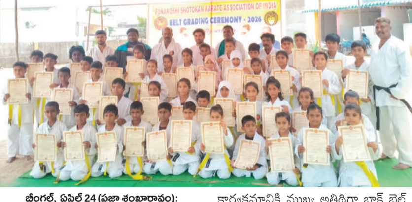
భీంకల్, ఏప్రిల్ 24 (ప్రజా శంఖారావం):

భీంకల్ మండలంలోని ఆక్స్ ఫర్ట్ హై స్కూల్ లో శుక్రవారం కరాటే బెల్టింగ్ అవార్డు కార్యక్రమాన్ని ఘనంగా నిర్వహించారు. ఈ