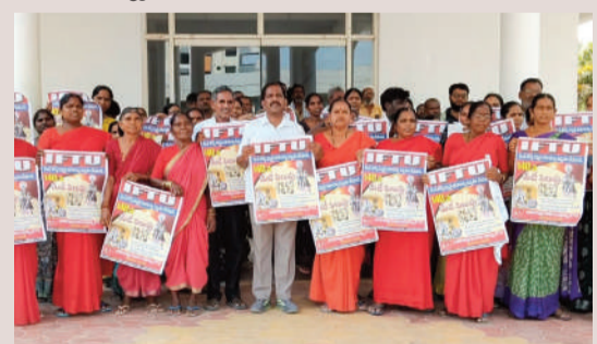
ఆర్కార్, ఏప్రిల్ 24 (ప్రజా శంఖారావం):