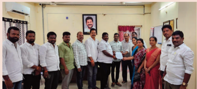
కామారెడ్డి, జూన్ 3 (ప్రజా శంఖారావం):

కామారెడ్డి పట్టణంలోని 49 వార్డుల్లో నెలకొన్న సమస్యలను వార్డుల వారిగా జాబితా రూపొందించి బీజేపీ మున్సిపల్ కౌన్సిలర్లు మున్సిపల్ కమిషనర్ పర్యటనకు వినతిపత్రం అందజేశారు. ఈ సందర్భంగా కౌన్సిలర్లు మాట్లాడుతూ, పట్టణంలోని చాలా వార్డుల్లో శానిటేషన్, సీసీ రోడ్లు, డ్రైనేజీ సమస్యలు తీవ్రంగా ఉన్నాయని తెలిపారు. రానున్న వర్షాకాలాన్ని దృష్టిలో ఉంచుకొని వరద నీటి ఇబ్బందులు తలెత్తకుండా ముందస్తు చర్యలు చేపట్టాలని కోరారు. పెద్ద డ్రైనేజీలో పేరుకుపోయిన మట్టిని వెంటనే తొలగించి, గత వర్షాకాలంలో ఎదురైన సమస్యలు పునరావృతం కాకుండా చర్యలు తీసుకోవాలని కమిషనర్ ను విజ్ఞప్తి చేశారు. ప్రజా సమస్యల పరిష్కారానికి బీజేపీ కౌన్సిలర్లు పూర్తి సహకారం అందిస్తామని తెలిపారు.