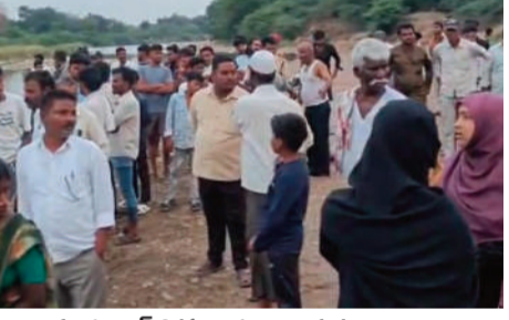
తాండూరు జూన్ 3 (ప్రజా శంఖారావం):

కాగ్నా నదిలో ఈతకు వెళ్లిన ఇద్దరు స్నేహితుల్లో ఒకరు మృతి చెందగా మరొకరు నదిలో గల్లంతయ్యారు. ఈ ఘటన వికారాబాద్ జిల్లా యాలాల పోలీస్ స్టేషన్ పరిధిలో బుధవారం చోటుచేసుకుంది. స్థానికులు తెలిపిన వివరాల ప్రకారం.. శుభ కార్యానికి వచ్చిన బంధువులతో కలిసి సరదాగా ఈతకొలను కోసమని యాలాల మండలం కోకట్ గ్రామ సమీపంలో ఉన్న కాగ్నా నది కి కుటుంబ సభ్యులతో కలిసి ఈతకు వెళ్లారు. ఈ క్రమంలో నదిలో చాకలి గుండ్ల మధ్యన లోతు ఉన్న ప్రదేశంలోకి ఇద్దరు వెళ్లి గల్లంతయ్యారు. దీంతో ఒక వ్యక్తి మృతి చెందగా మరొకరు గల్లంతయ్యారు. విషయం తెలుసుకున్న యాలాల పోలీసులు సంఘటన స్థలానికి చేరుకొని ఆచూకీ కోసం గాలింపు చర్యలు చేపట్టారు. వీరు పాత తాండూరుకు చెందిన వ్యక్తులు గా గుర్తించినట్లు తెలుస్తోంది. ఇంకా పూర్తి వివరాలు చేయాల్సి ఉంది.