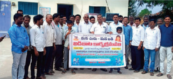
జుక్కల్, జూన్ 3 (ప్రజా శంఖారావం):