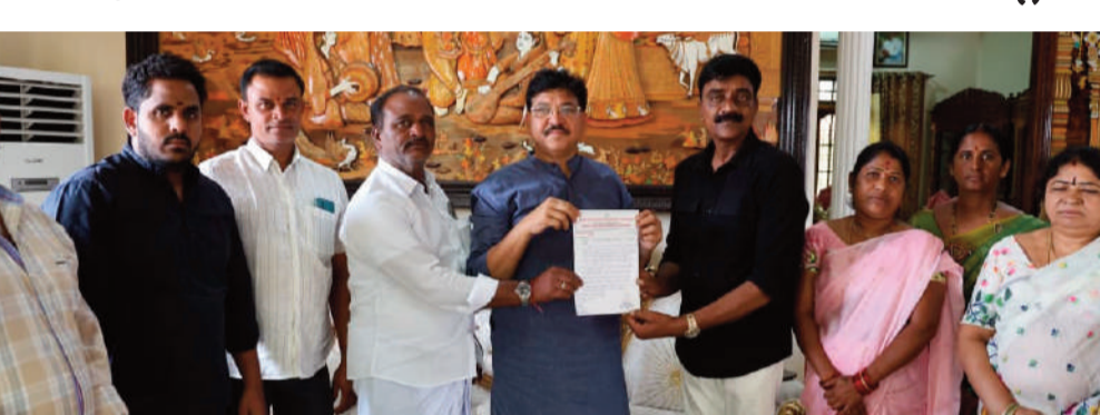
ఆర్కూర్, జూన్ 3 (ప్రజా శంఖారావం):